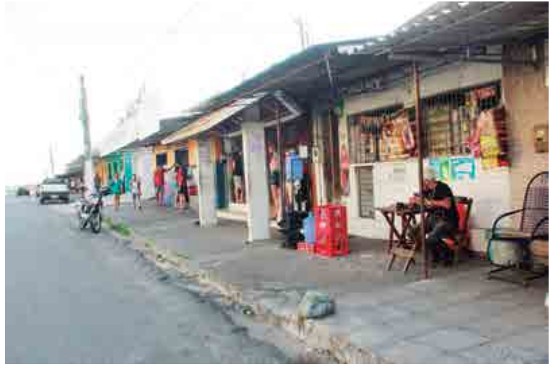
Localizado entre os bairros de Costa e Silva e Esplanada, o Ernani Sátiro possui uma característica econômica voltada para o comércio local que se divide entre pequenos supermercados, padarias, posto de combustível e uma grande variedade de lojas