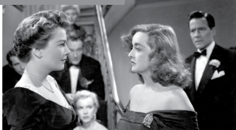
Da esq. para dir.: Anne Baxter (E) e Bette Davis (D) se encaram nos bastidores da Broadway em ‘A Malvada’; cena da animação da Disney ‘Cinderela’