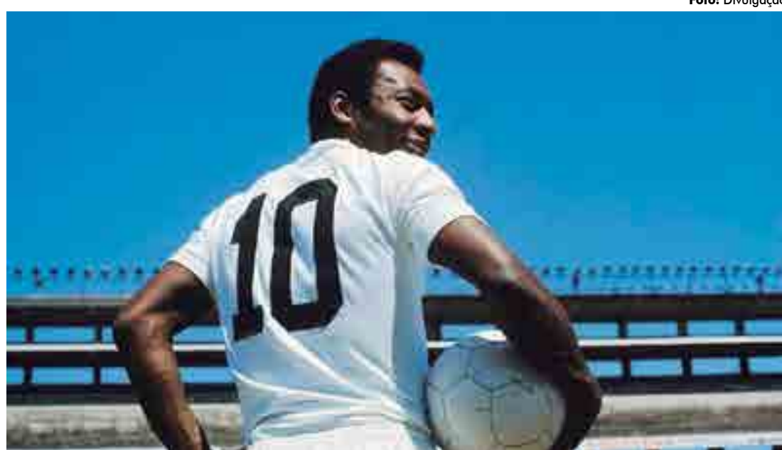
Pelé construiu uma história fantástica nos gramados e até hoje é motivo de orgulho para o futebol brasileiro

Será se as novas gerações sabem que Pelé disputou quatro Copas do Mundo e venceu três? Que ele foi duas vezes campeão do mundo, interclubes? Que conquistou por duas vezes a Taça Libertadores da América? Conquistou cinco vezes a Taça Brasil e