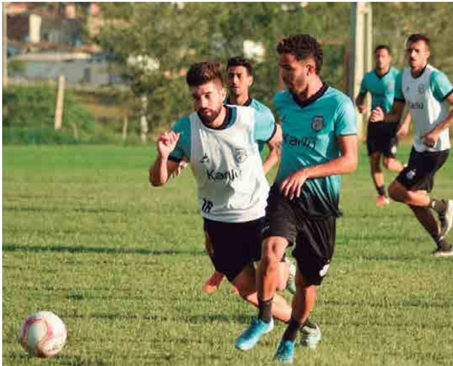
Jogadores do Treze treinaram bastante durante a semana na esperança de conseguir uma reabilitação e seguir sonhando com a classificação à segunda fase