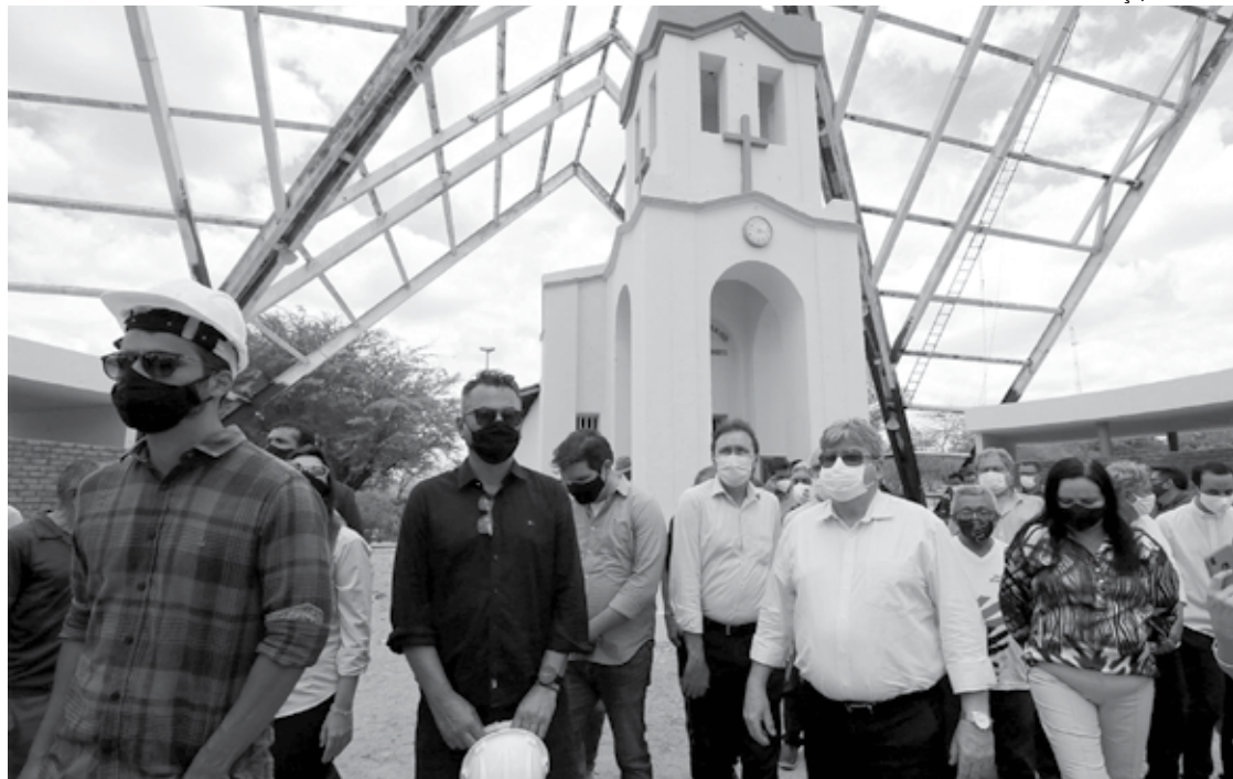
João Azevêdo conferiu os projetos que estão sendo desenvolvidos no município de Patos, que completa hoje 117 anos de emancipação política, e ressaltou o esforço feito para garantir o bem-estar social e econômico da população paraibana durante a pandemia