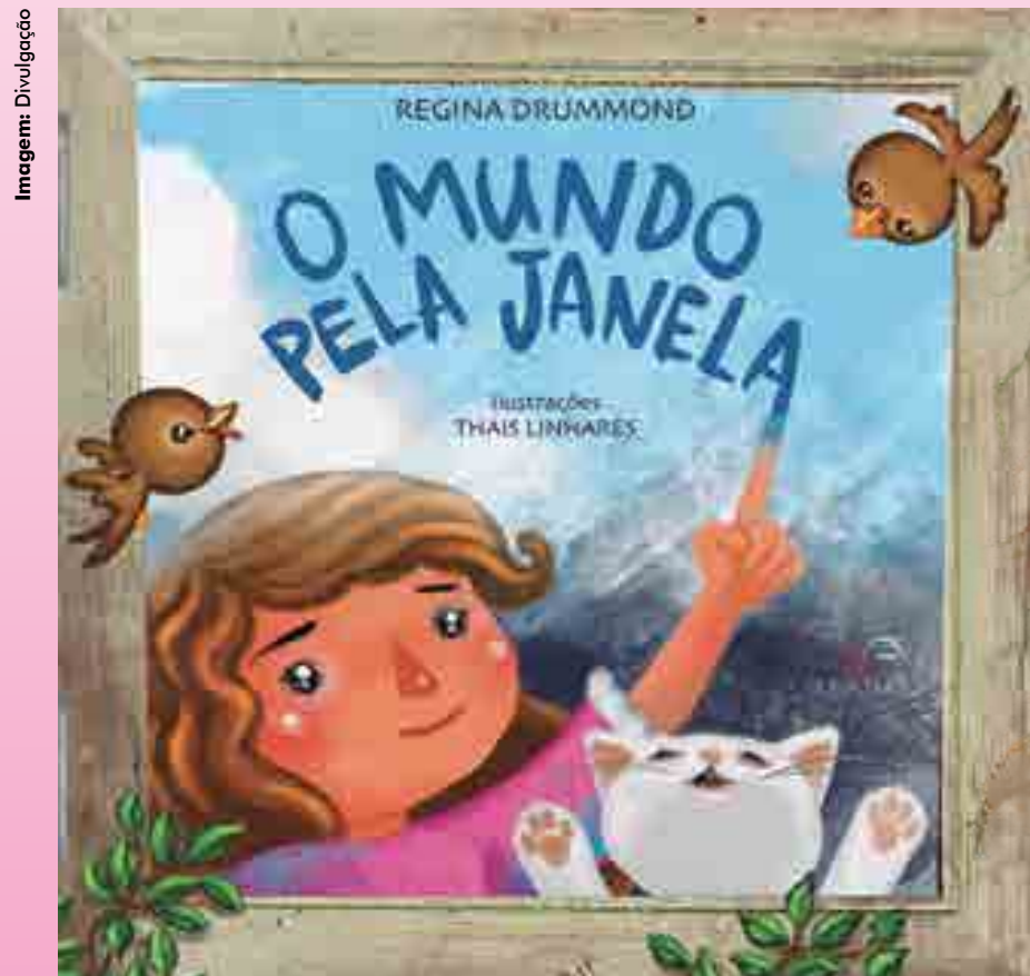
Com ilustrações de Thais Linhares, obra de Regina Drummond (foto) se utiliza de versos para declamar a sensação de confinamento; vírus da covid é visto como verdadeiro monstro e o passaporte para a liberdade reside em uma determinada janela: a da literatura

Através do QR Code acima, acesse o site oficial da Regina Drummond