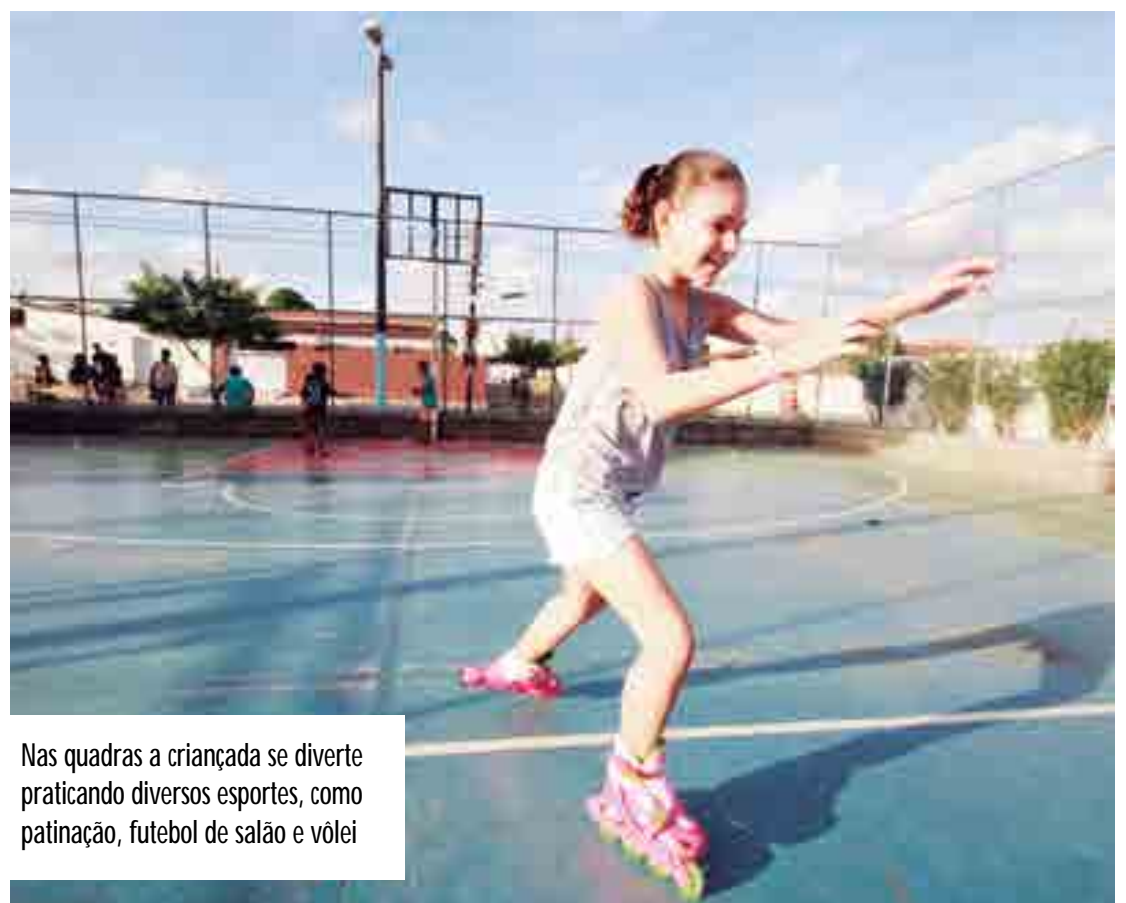
Nas quadras a criançada se diverte praticando diversos esportes, como patinação, futebol de salão e vôlei