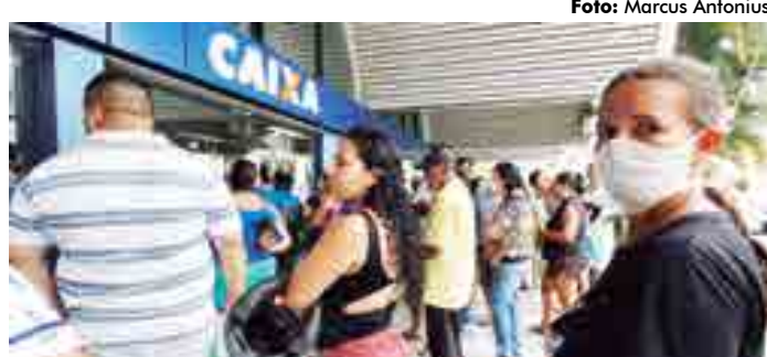
São 59 mil pessoas a mais desocupadas entre os meses de maio e setembro

Em maio, quando o índice de desocupação na Paraíba era de 9,8%, um total de 141 mil pessoas estavam desocupadas. De maio a junho, esse percentual saltou 1,5 pontos e atingiu 11,3%. Entre junho e agosto esse crescimento ficou abaixo do meio ponto, em cada mês. Em julho a taxa de desocupação na Paraíba era de 11,6%, no mês seguinte, em agosto, a taxa registrada foi 11,9%. Entre agosto e setembro o índice registrou uma alta de 1,8%,