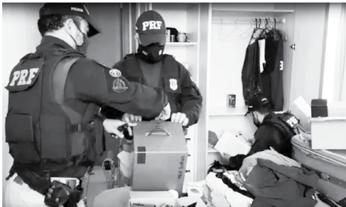
No apartamento onde a dupla se escondia, os policiais apreenderam material das cargas roubadas pelo grupo

A quadrilha atuava roubando cargas na Paraíba, Rio Grande do Norte e Pernambuco. O grupo rendia os motoristas de caminhão com o uso de armas de fogo e violência. A carga era roubada em um Estado e descarregada em outro como forma